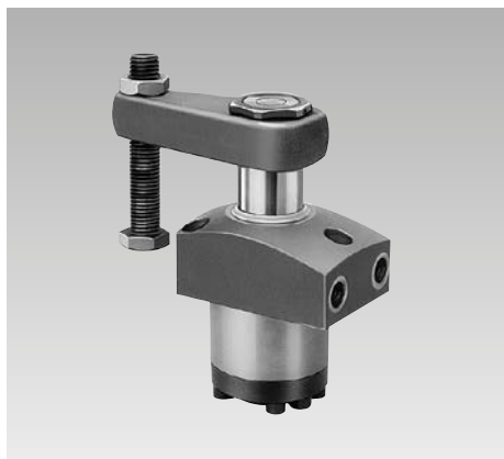
Ejemplo: Garras giratorias Referencia 1895 103